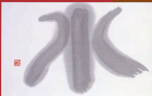
1：《にんげんだもの》1980年